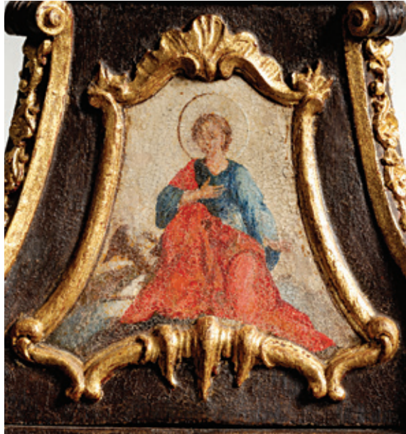
Сл. 7. Макета звоничке капе српске цркве у Будиму, детаљ, 1774, Српски црквени музеј, Сентандреја.

Идеја да се на макети, а потом и на звоничкој капи будимске цркве, сликају јеванђелисти могла је бити инспирисана, између осталог, и руско-украјинским