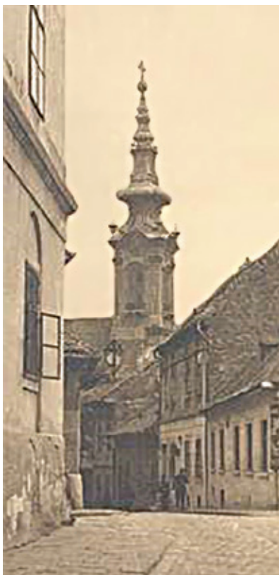
Сл. 8. Део предграђа Табана са звоником српске цркве, око 1930