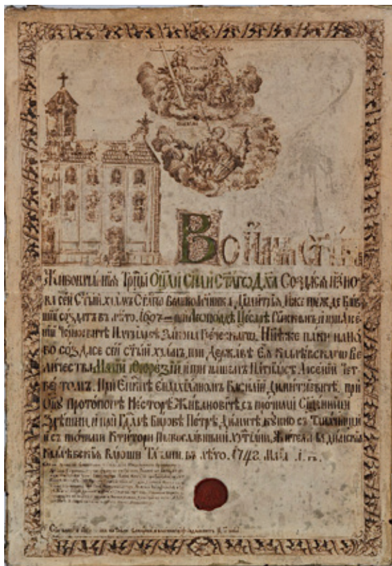
Сл. 3. Повеља са ведутом српске цркве у Будиму, рад Михаила Соколовића, 1773, Српски црквени музеј, Сентандреја.

односу на висину приказане јужне фасаде са прозорима. На цртежу Михаила Соколовића који показује стање цркве из 1773. године, од детаља треба истаћи и горњи део звоника на којем је испуст поткровног венца био полукружно заобљен на месту за сат и на тај начин држао конструкцију у облику скромне пирамиде. То значи да је зидани део звоника био у потпуности изграђен и погодан да уместо привременог покроба са шиндром прими прикладнију и репрезентативнију декоративну капу, која ће бити у складу са монументалним изгледом цркве, која је у XVIII веку, по основним димензијама, а посебно по пространом наосу, била највећа у Карловачкој митрополији.