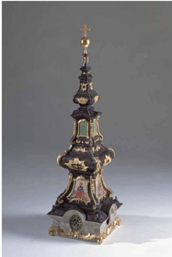
Сл. 5. Макета звоничке капе српске цркве у Будиму, рад дуборезбара Јозефа Леонарда Вебера, 1774, Српски црквени музеј, Сентандреја.

У XVIII веку архитектонски цртеж већ је скоро у потпуности заменио модел који је у средњем веку био уобичајен. Најчешће су цртани основа, фасадни делови и подужни пресек грађевине, а у случају комплекснијих објеката наручени су и прикази из птичје перспективе. Макета одређене грађевине наручена је најчешће на