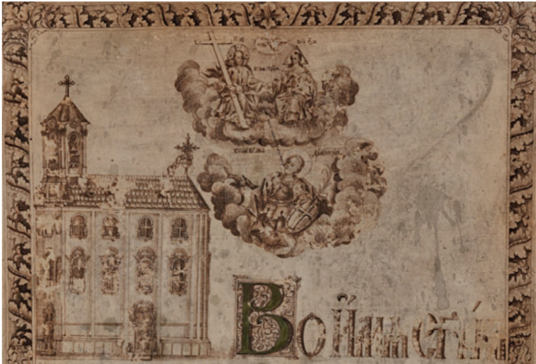
Сл. 4. Повеља са ведутом српске цркве у Будиму, детаљ, рад Михаила Соколовића, 1773, Српски црквени музеј, Сентандреја.

у српском барокном сликарству. Видимо Исуса Христа како седи на облацима и десном руком придржава издужени крст, док је Бог Отац представљен како десницом благосиља, а левом руком придржава Земљину куглу. Изнад Исуса Христа и Бога Оца у расветљеном сегменту, из којег извиру зраци, нацртан је голуб Светог Духа који је окренут према Христу. Испод представе Свете Тројице уздиже се у облацима лик Светог великомученика Димитрија који је представљен у фигури до колена као војник који носи панцир са маском на левом рамену. Он се помало ослонио на овални штит са крстом који држи у левој руци заједно са палмином гранчицом, док је десну руку испружио у молитвеном ставу подижући на тај начин поглед према Светој Тројици. На покрет Светог Димитрија и на његов гест, који има наглашено девиционално значење, надовезује се текст који он изговара и који је написан искрено као у огледалу. Треба истаћи да тај начин исписивања слова у огледалу овде има метафорично значење и упућује на молитвени поредак који се одвија у небеској сфери у којој је потврђена и посредничка улога Светог Димитрија. Без обзира на оштећења и нечитке делове, речи које изговара Свети Димитрије можемо разумети и превести као посебну молитвену реченицу „Погледај Господе на дом (храм) славе