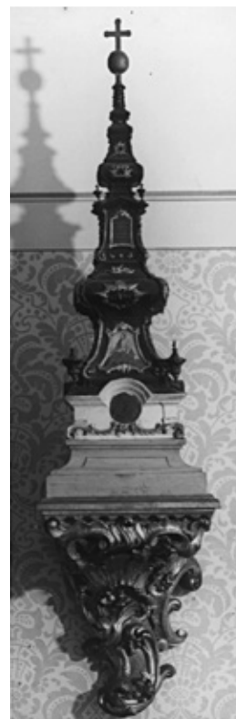
Сл. 9. Архивска фотографија макете са конзолом, око 1935, Фототека Историјског музеја Будимпеште.